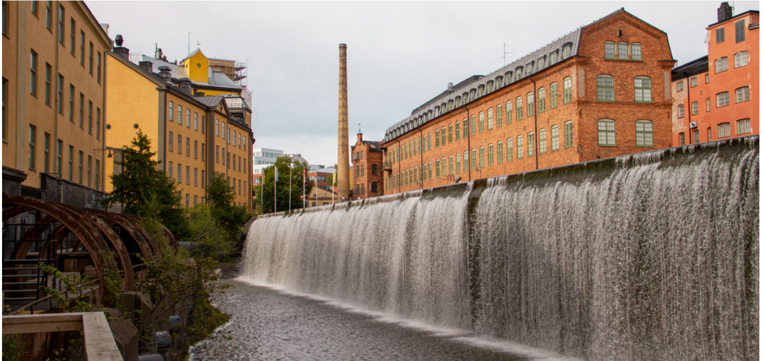
Vattenfallet i Industrilandskapet.

Är du redo att lämna storstadspulsen i Stockholm för en lugnare och charmigare tillvaro i Norrköping? Att flytta från Stockholm till Norrköping är ett stort steg – men också en fantastisk möjlighet till ett nytt kapitel i livet. Kanske lockas du av lägre boendekostnader, närheten till naturen eller Norrköpings unika småstadskänsla? Oavsett anledning är en lyckad flytt beroende av bra planering och rätt stöd. I detta inlägg guidar vi dig genom processen och visar hur Jordgubbsprinsen Flyttfirma kan göra din flytt smidig, stressfri och prisvärd.