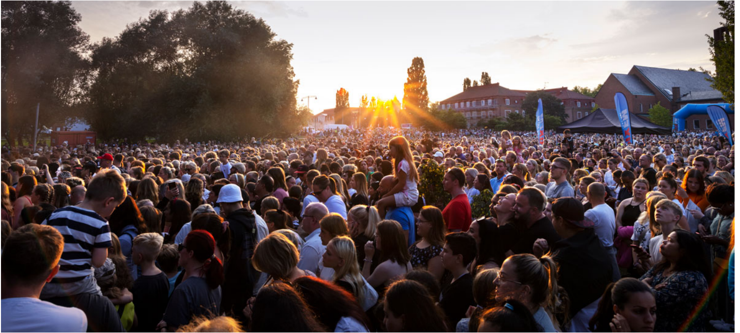
Publikhav med solnedgång i Vasaparken under Augustifesten 2022.